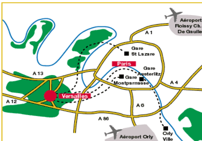
A13 sortie n°6 Versailles Ouest - Saint-Germain